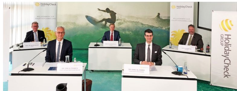
Vor Beginn der virtuellen Hauptversammlung 2020 der HolidayCheck Group AG

Anfang April 2020 beendete die HolidayCheck Group AG vorzeitig das im Februar gestartete Aktienrückkauf-